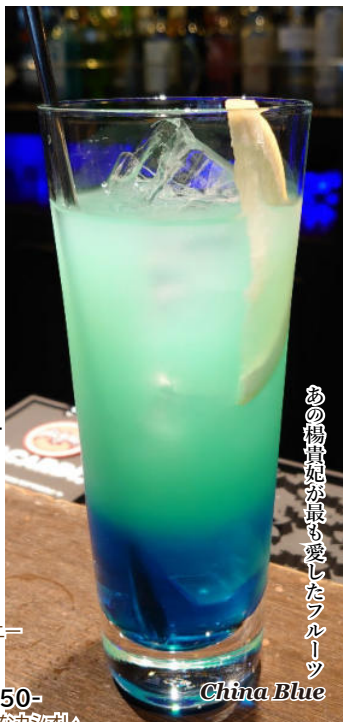
あの楊貴妃が最も愛したフルーツ China Blue