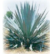
原料となる(竜舌蘭) Agave tequilana

スペインによるメキシコ統治時代、ハリスコ州の西方に位置するシエラマドレ山脈で山火事があり、その焼け跡から良い匂いを発し甘い樹液を出す、焦げた竜舌蘭が発見され、人々がこれを元に加工、完成したのがテキーラの原型とか…この蒸溜酒の蒸溜工場が置かれた村がテキーラであり、それがそのまま酒の名前となった。