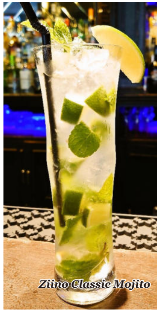
Ziino Classic Mojito

ジノクラシック歴代バーテンダーが常に磨き続けてきた抜群レシピにより常に高評価を得ております