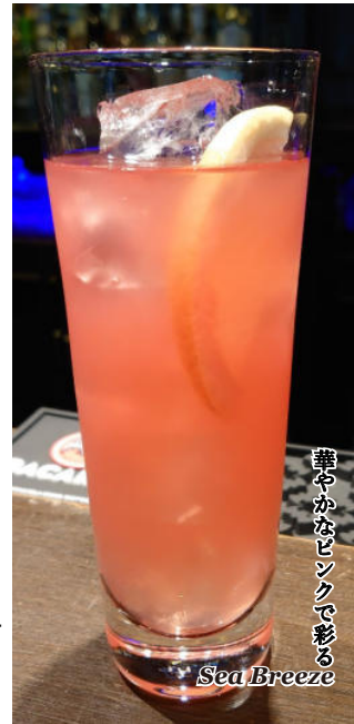
華やかなピンク色する Sea Breeze