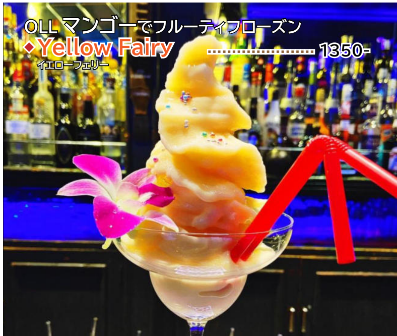
OLL マンゴーでフルーフローズン ◆Yellow Fairy ..... 1350- イエローフェアリー