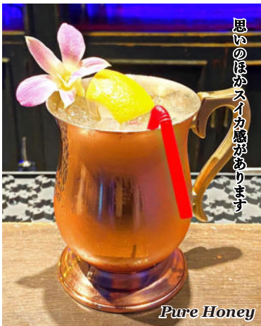
思いのほかスイカ感があります Pure Honey