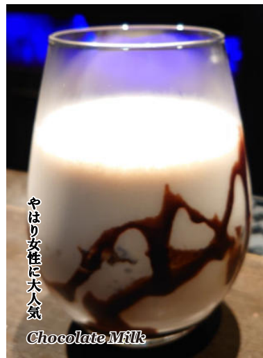
やはり女性に大人気 Chocolate Milk