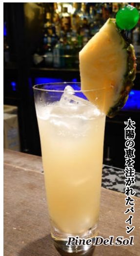
Pine Del Sol