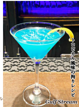
トロピカル風味の拘りレシビ Gulf Stream