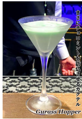
パッションを感じるカクテル Gurass Hopper