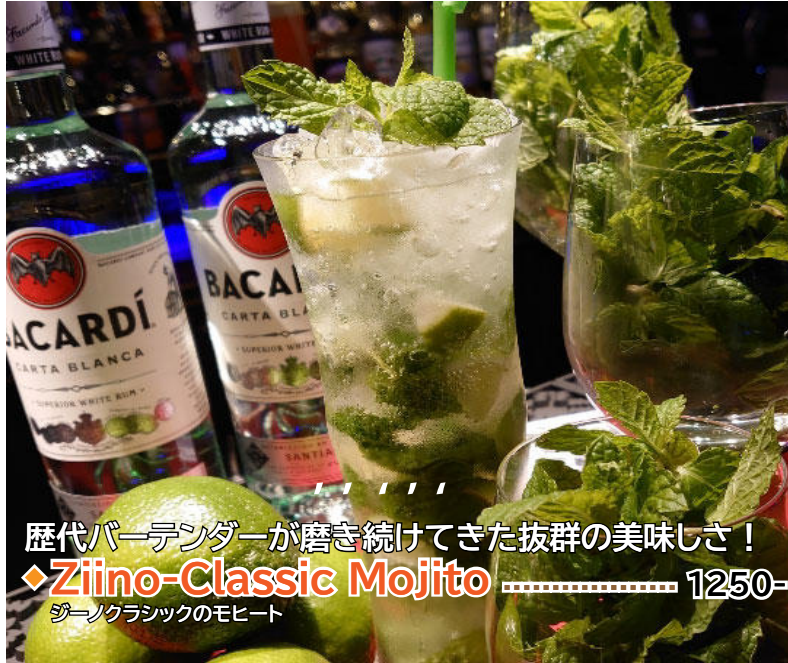
歴代バーテンダーが磨き続けてきた抜群の美味しさ！ ◆Ziino-Classic Mojito ..... 1250- ジノクラシックのモヒート