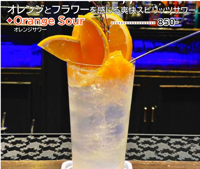
オレンジとフラワーを感じる爽快スピリッツサワー ◆Orange Sour ..... 850- オレンジサワー