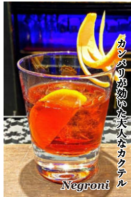
カンパリが効いた大人なカクテル Negroni