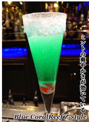
爽やかな青いサンゴ礁 Blue Coral Reef Z-style