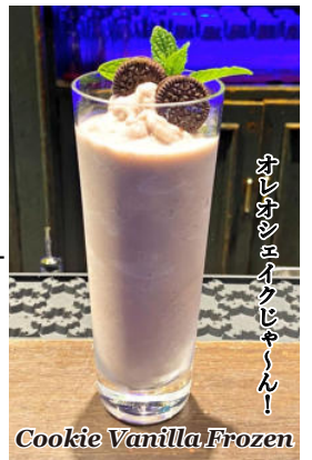
オレオシエイクじゃーん! Cookie Vanilla Frozen