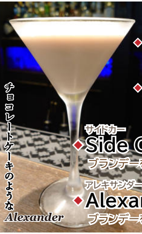
サイドカーのような Alexander