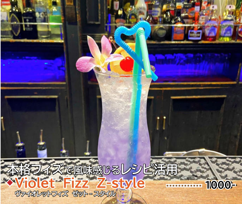
本格フイズで風味感じるレシピ活用 ◆Violet Fizz Z-style ..... 1000- ヴァイオレットフイズ ゼット-スタイル