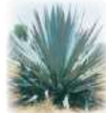
原料となる(竜舌蘭) Agave tequilana

スペインによるメキシコ統治時代、ハリスコ州の西方に位置するシエラマドレ山脈で山火事があり、その焼け跡から良い匂いを発し甘い樹液を出す、焦げた竜舌蘭が発見され、人々がこれを元に加工、完成したのがテキーラの原型とか…この蒸溜酒の蒸溜工場が置かれた村がテキーラであり、それがそのまま酒の名前となった。