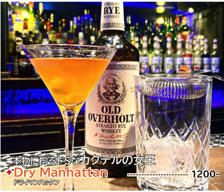
本物に拘るDSなカクテルの女王 ◆Dry Manhattan ..... 1200- ドライマンハッタン