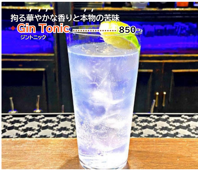
拘る華やかな香りと本物の苦味 ◆Gin Tonic ..... 850- ジントニック